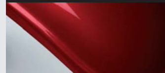
Rosso robino effetto perla