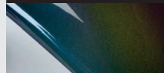
Camaleonte effetto speciale