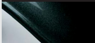
Nero pantera effetto perla