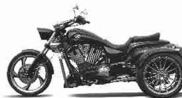
CT 1700 V