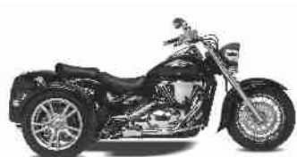
CT 800 S