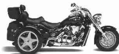
CT 1800 S